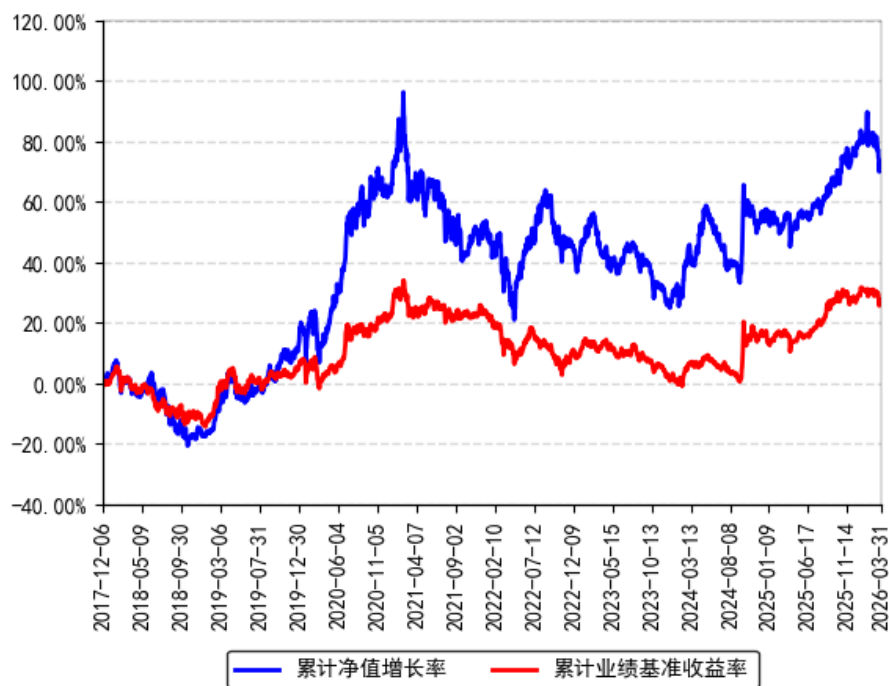
南方优享分红灵活配置混合A累计净值增长率与同期业绩比较基准收益率的历史走势对比图