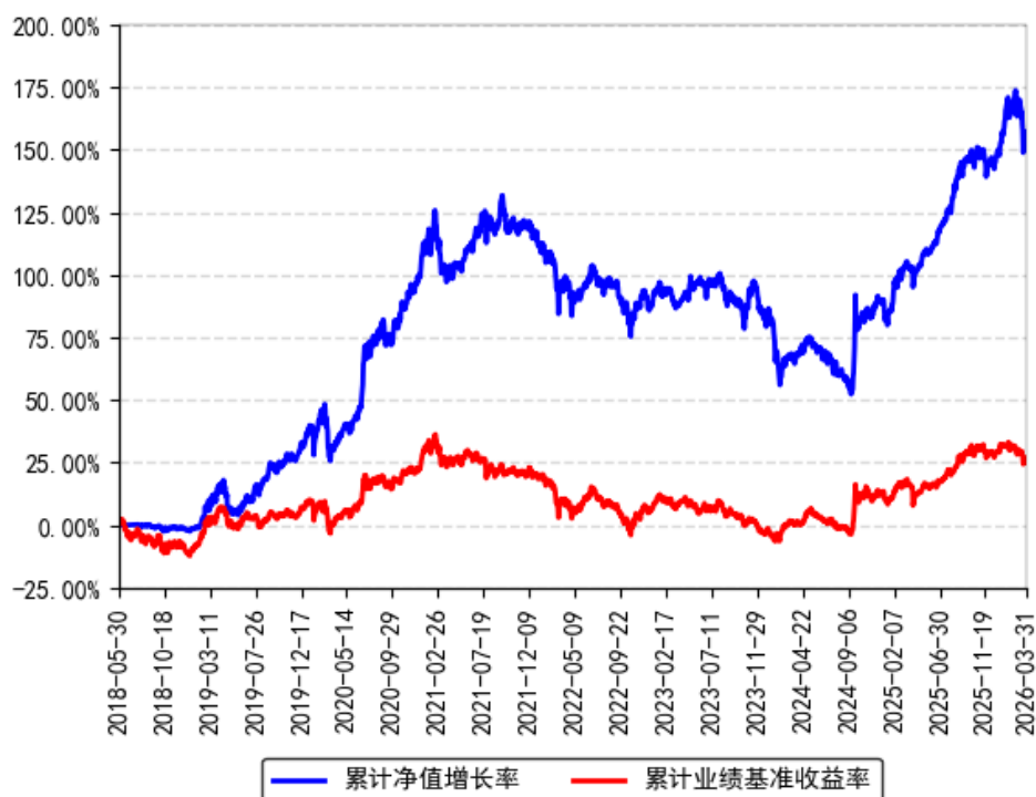
南方君信灵活配置混合A累计净值增长率与同期业绩比较基准收益率的历史走势对比图