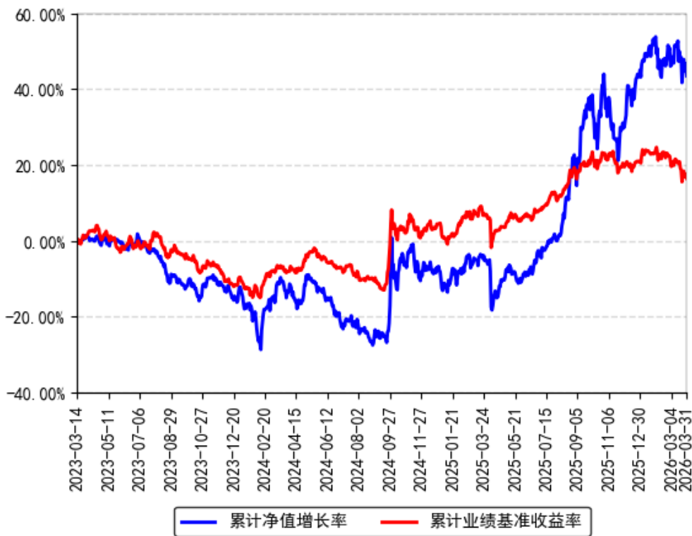
南方景气前瞻混合A累计净值增长率与同期业绩比较基准收益率的历史走势对比图