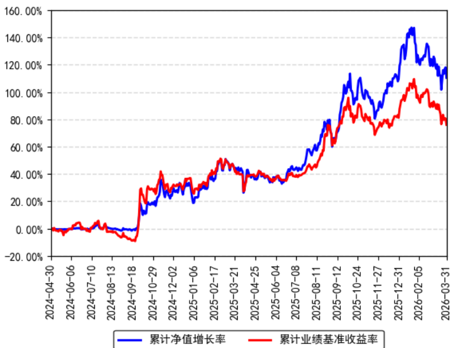
南方半导体产业股票发起A累计净值增长率与同期业绩比较基准收益率的历史走势对比图