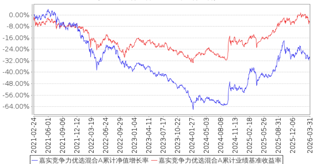
嘉实竞争力优选混合A累计净值增长率与同期业绩比较基准收益率的历史走势对比图 (2021年02月24日至2026年03月31日)