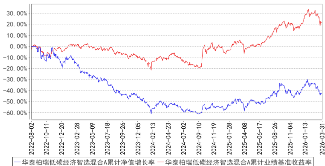
华泰柏瑞低碳经济智选混合A累计净值增长率与同期业绩比较基准收益率的历史走势对比图