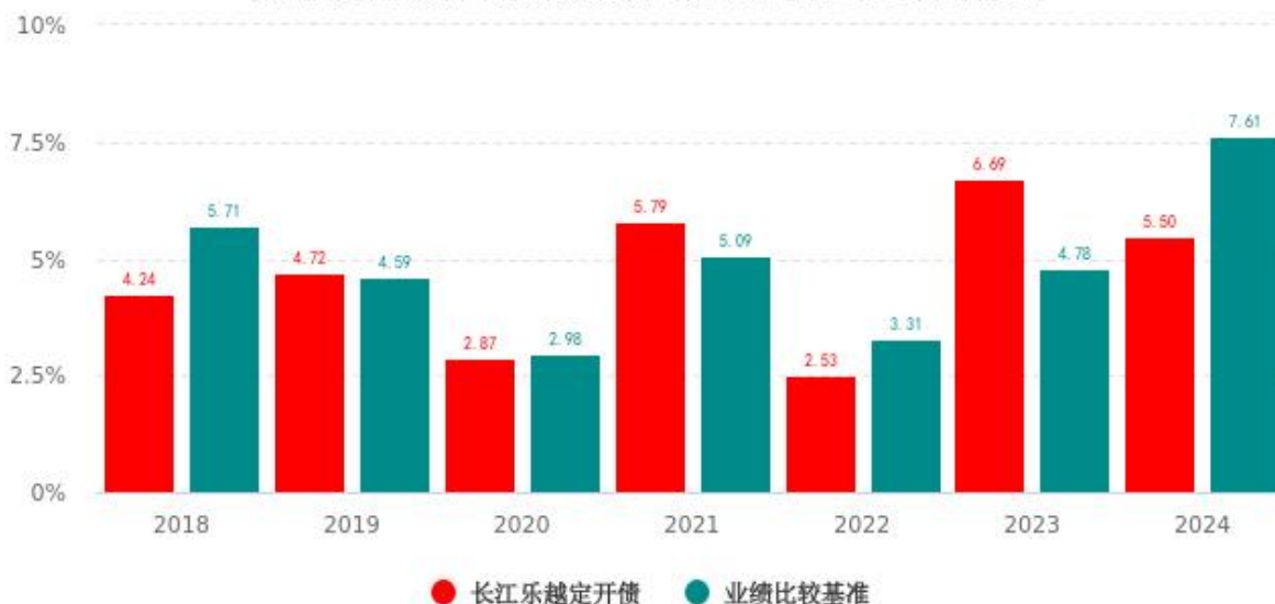
基金的过往业绩不代表未来表现, 数据截止日: 2024年12月31日

注: 本基金基金合同生效日为 2018 年 04 月 12 日, 基金合同生效当年的基金净值增长率及同期业绩比较基准收益率按当年实际存续期计算, 不按整个自然年度进行折算。