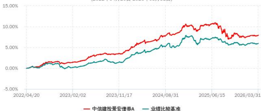
中信建投景安债券A累计净值增长率与业绩比较基准收益率历史走势对比图 (2022年04月20日-2026年03月31日)