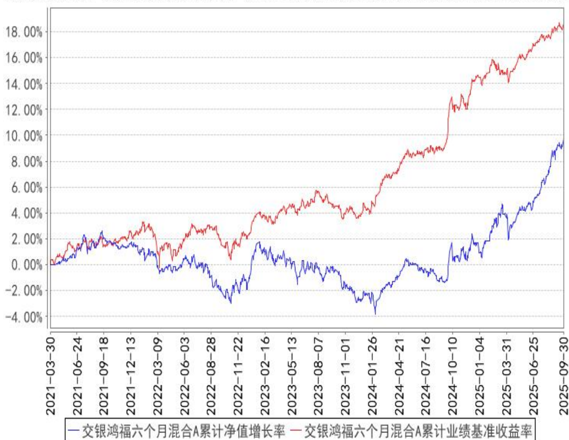
交银鸿福六个月混合A累计净值增长率与同期业绩比较基准收益率的历史走势对比图