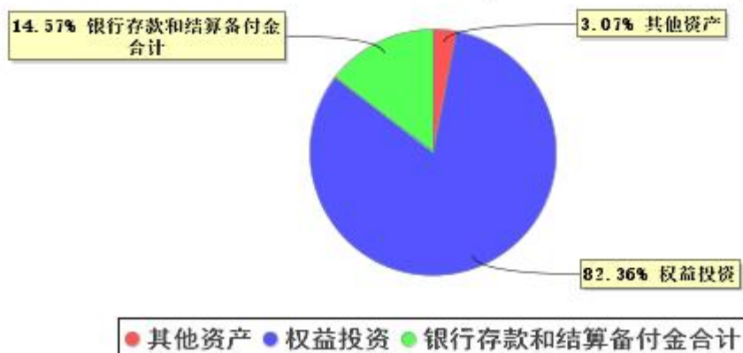
投资组合资产配置图表(2026年3月31日)