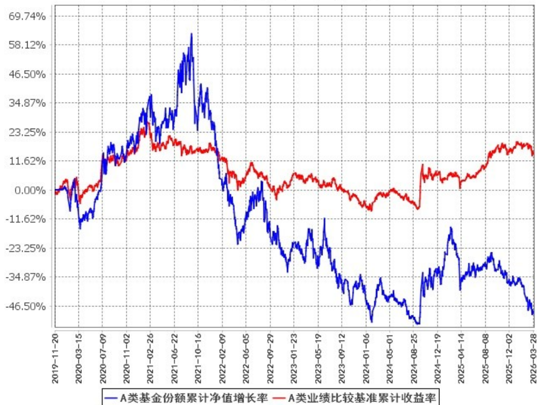
A类基金份额累计净值增长率与同期业绩比较基准收益率的历史走势对比图 (2019年11月20日至2026年3月31日)