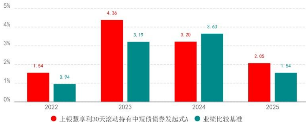
基金的过往业绩不代表未来表现，数据截止日：2025年12月31日