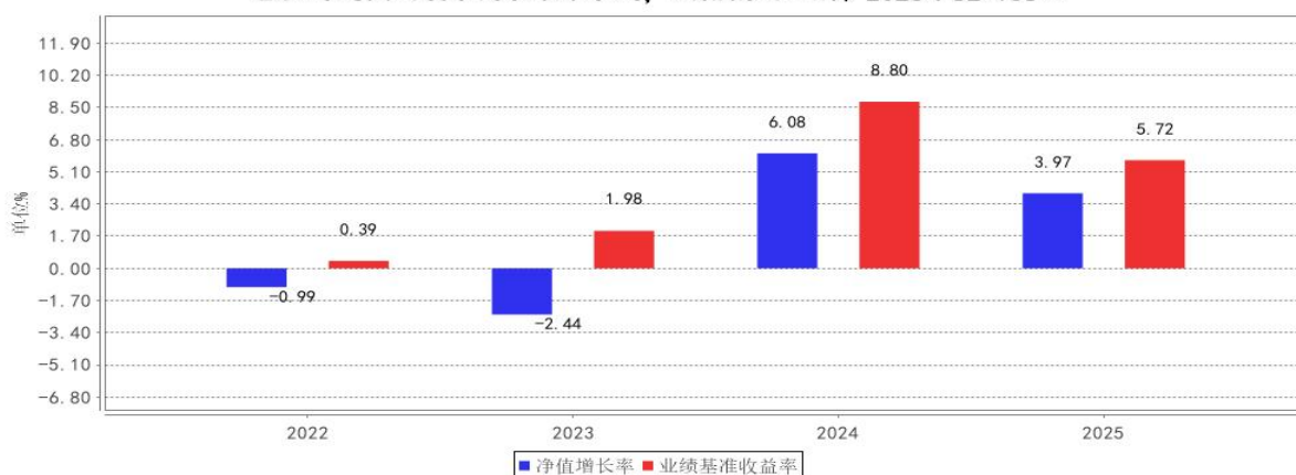
中欧预见稳健养老目标一年持有混合（FOF）Y 基金的过往业绩不代表未来表现，数据截止日期：2025年12月31日

注：1. 基金增加份额当年期间的相关数据按实际存续期计算。 2. 本产品于 2023/11 修改投资范围，增加公募 REITS 为投资标的。