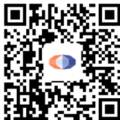
国泰海通资管APP下载二维码

投资者可以在应用市场搜索“国泰海通资管”，或者扫描下方二维码，下载国泰海通资管 APP，了解基金产品、服务等信息。