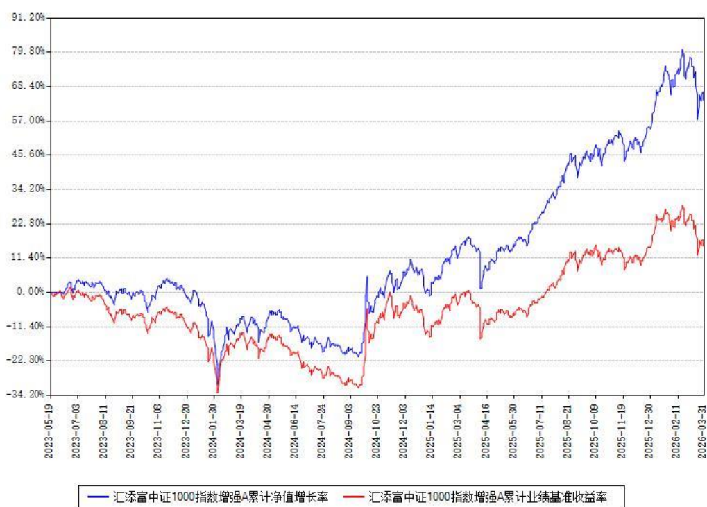
汇添富中证1000指数增强A累计净值增长率与同期业绩基准收益率对比图

(二) 自基金合同生效以来基金累计净值增长率变动及其与同期业绩比较基准收益率变动的比较图