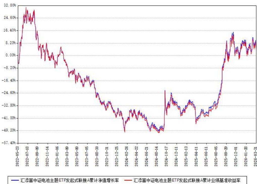
汇添富中证电池主题ETF发起式联接A累计净值增长率与同期业绩基准收益率对比图

(二)自基金合同生效以来基金累计净值增长率变动及其与同期业绩比较基准收益率变动的比较图