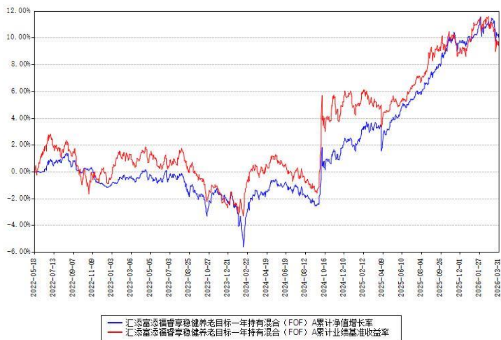
汇添富添福睿享稳健养老目标一年持有混合（FOF）A累计净值增长率与同期业绩基准收益率对比图

(二)自基金合同生效以来基金累计净值增长率变动及其与同期业绩比较基准收益率变动的比较图