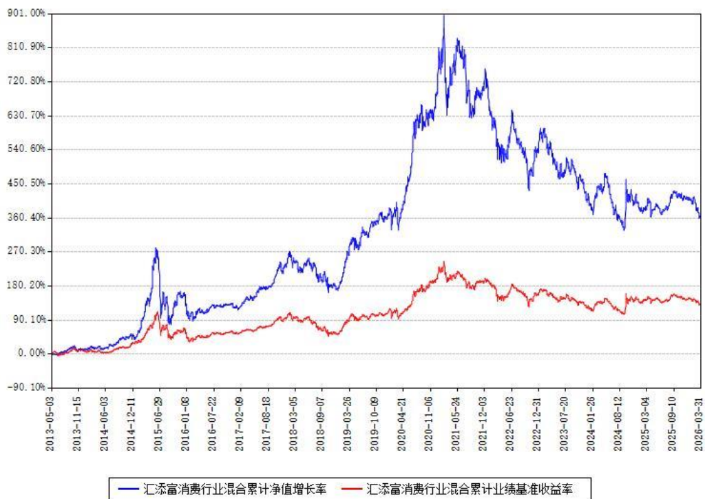
汇添富消费行业混合累计净值增长率与同期业绩基准收益率对比图