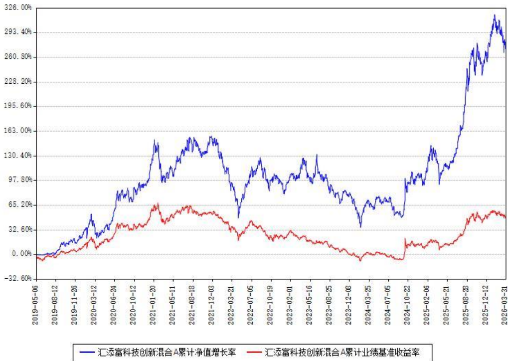
汇添富科技创新混合A累计净值增长率与同期业绩基准收益率对比图

(二)自基金合同生效以来基金累计净值增长率变动及其与同期业绩比较基准收益率变动的比较图