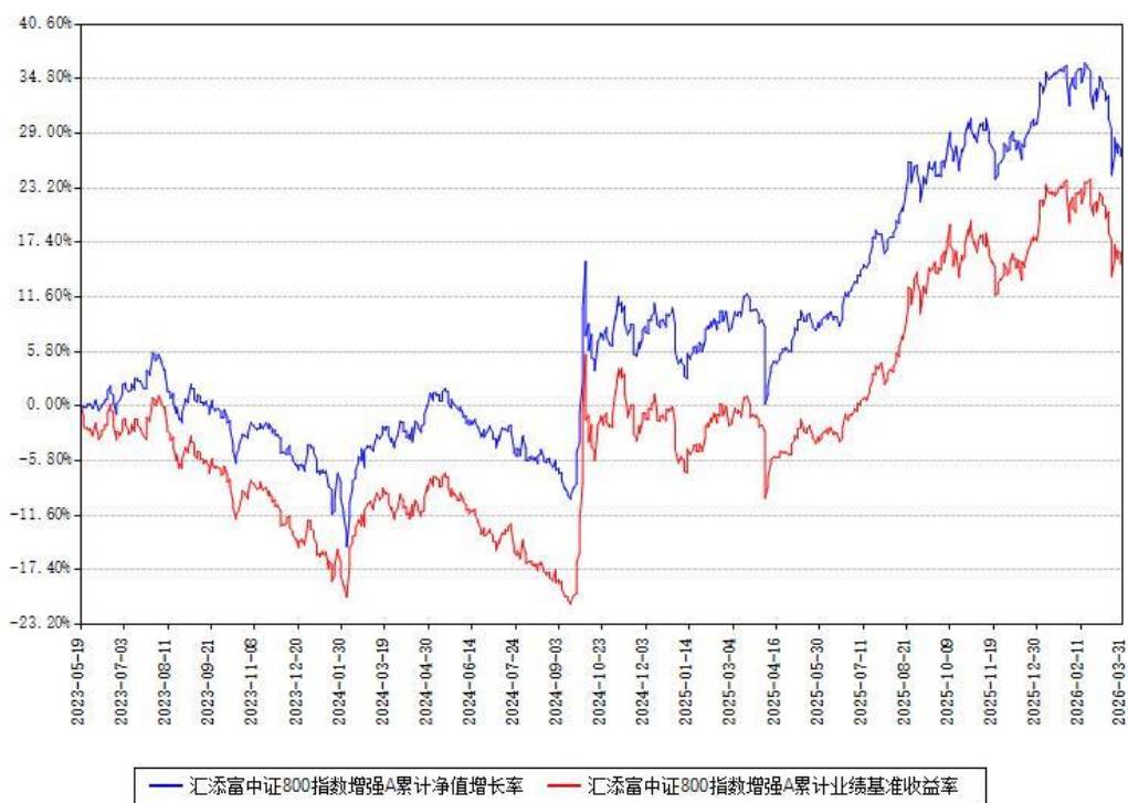
汇添富中证800指数增强A累计净值增长率与同期业绩基准收益率对比图

(二) 自基金合同生效以来基金累计净值增长率变动及其与同期业绩比较基准收益率变动的比较图