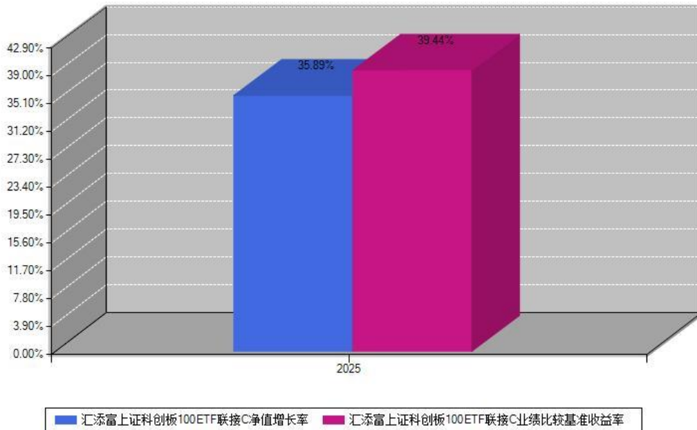
汇添富上证科创板100ETF联接C每年净值增长率与同期业绩基准收益率对比图

注：数据截止日期为2025年12月31日，基金的过往业绩不代表未来表现。本《基金合同》生效之日为2025年05月13日，合同生效当年按实际存续期计算，不按整个自然年度进行折算。