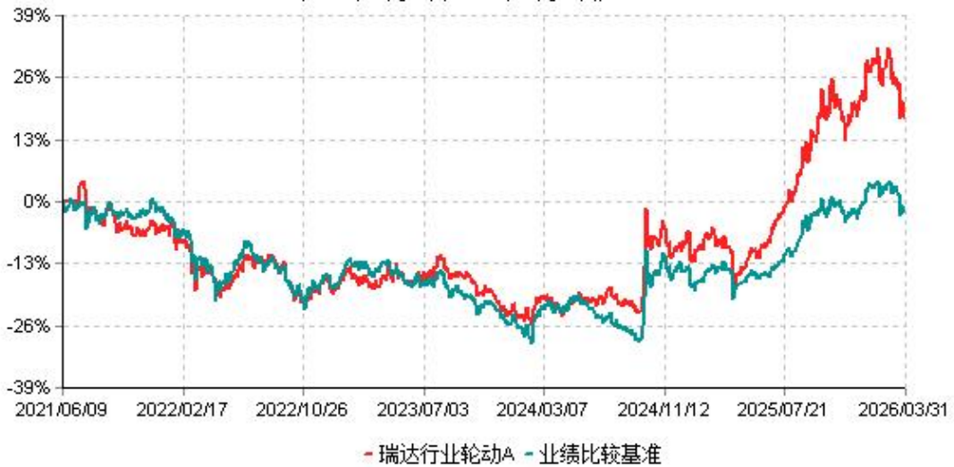
瑞达行业轮动A累计净值增长率与业绩比较基准收益率历史走势对比图 (2021年06月09日-2026年03月31日)