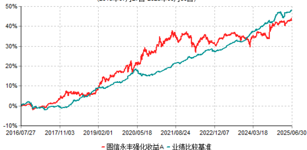
圆信永丰强化收益A累计净值增长率与业绩比较基准收益率历史走势对比图 (2016年07月27日-2025年06月30日)