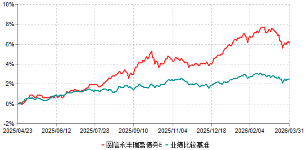
圆信永丰瑞盈债券E累计净值增长率与业绩比较基准收益率历史走势对比图 (2025年04月23日-2026年03月31日)

注：本基金于 2025 年 04 月 23 日增设 E 类份额，该份额的相关数据和指标按实际存续期计算。