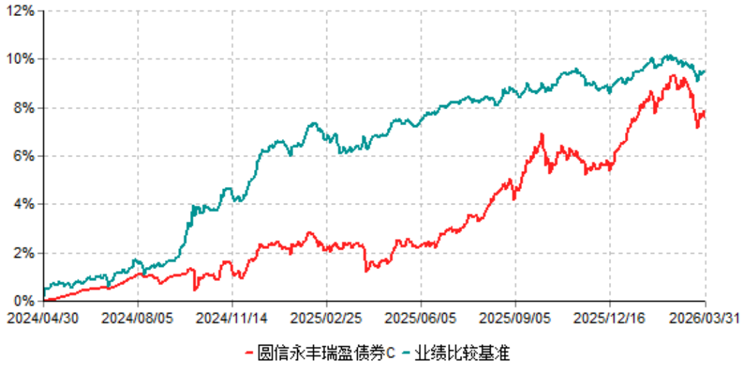
圆信永丰瑞盈债券C累计净值增长率与业绩比较基准收益率历史走势对比图 (2024年04月30日-2026年03月31日)