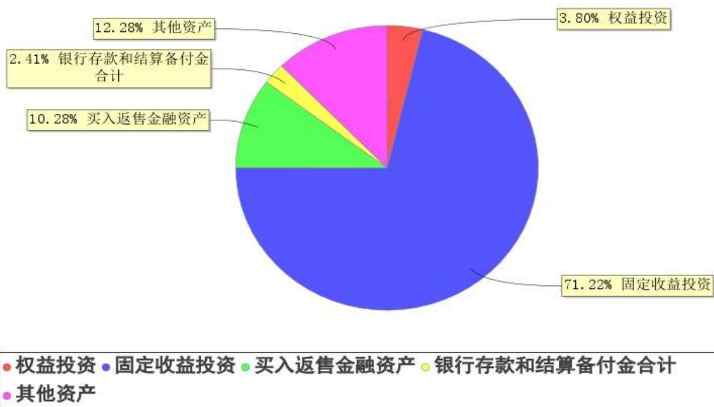
投资组合资产配置图表(2026年3月31日)