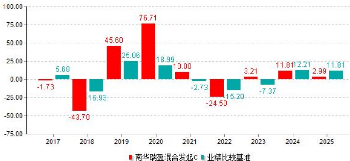
基金的过往业绩不代表未来表现；数据截止日：2025年12月31日 单位%