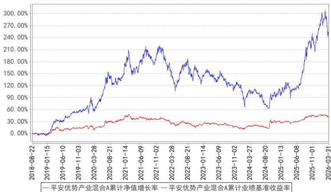
平安优势产业混合A累计净值增长率与同期业绩比较基准收益率的历史走势对比图