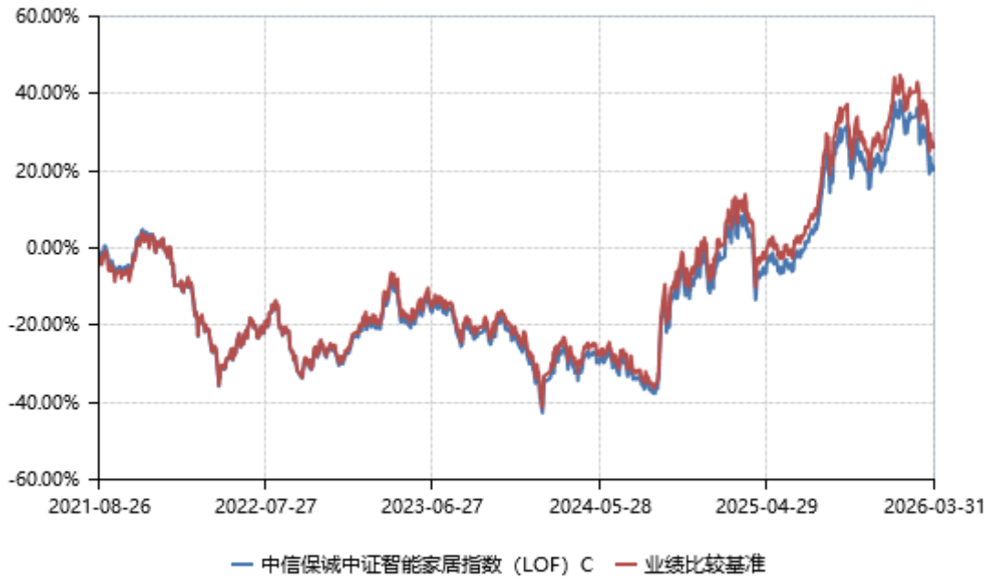
中信保诚中证智能家居指数（LOF）E