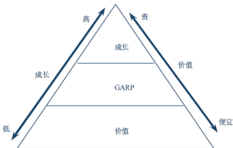
图 1 GARP 投资理念