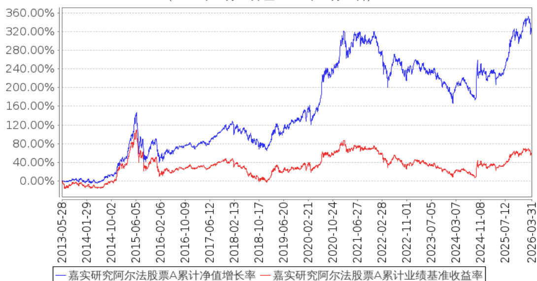
嘉实研究阿尔法股票A累计净值增长率与同期业绩比较基准收益率的历史走势对比图 (2013年05月28日至2026年03月31日)

(二) 自基金合同生效以来基金累计净值增长率变动及其与同期业绩比较基准收益率变动的比较