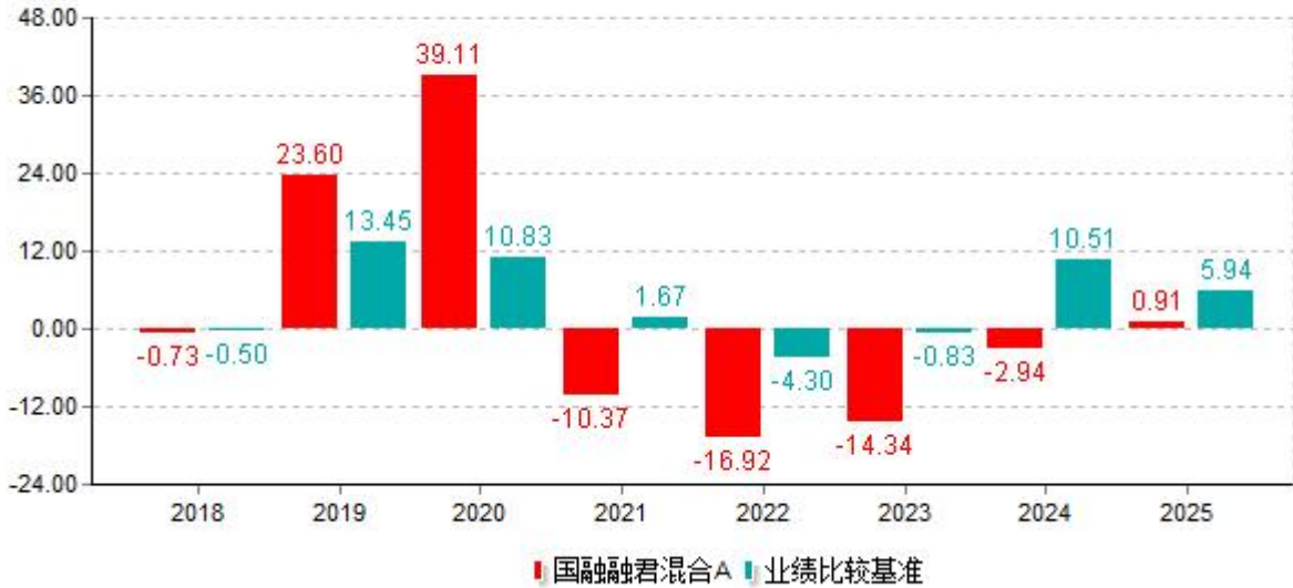
基金的过往业绩不代表未来表现；数据截止日：2025年12月31日 单位%