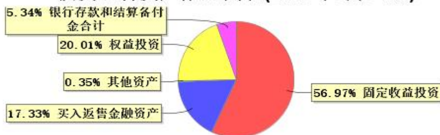
投资组合资产配置图表(2026年3月31日)