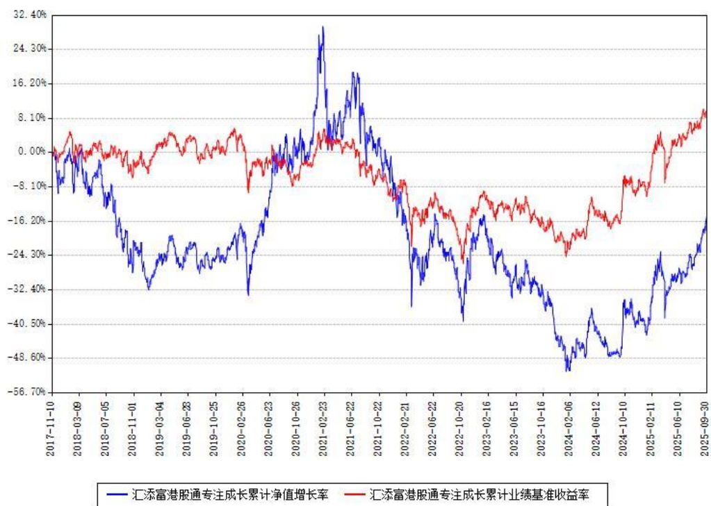
汇添富港股通专注成长累计净值增长率与同期业绩基准收益率对比图