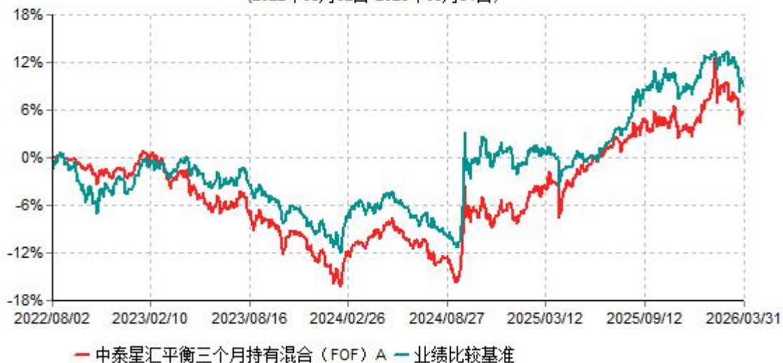
中泰星汇平衡三个月持有混合（FOF）A累计净值增长率与业绩比较基准收益率历史走势对比图 (2022年08月02日-2026年03月31日)