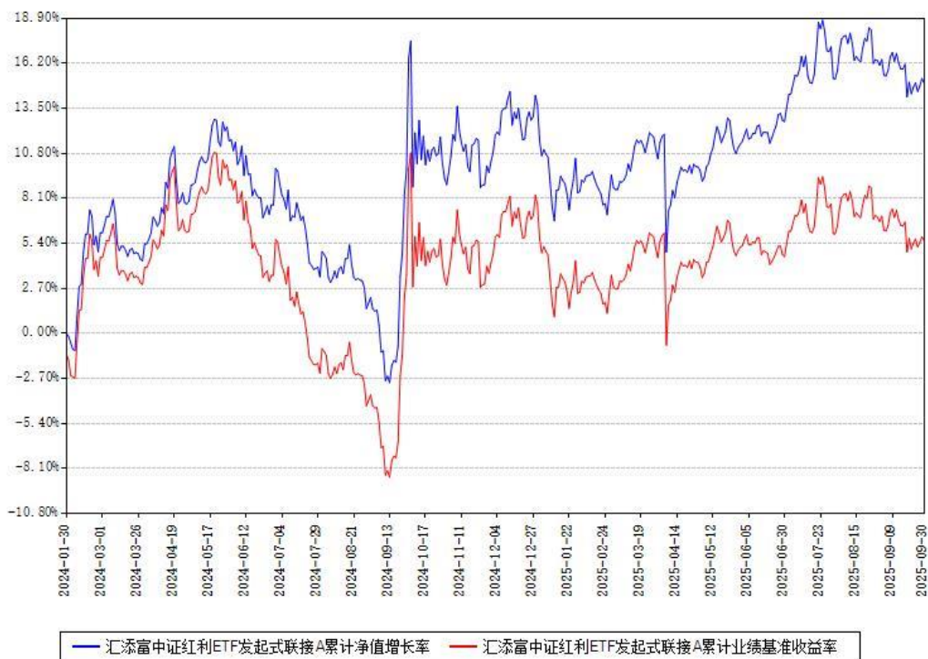
汇添富中证红利ETF发起式联接A累计净值增长率与同期业绩基准收益率对比图