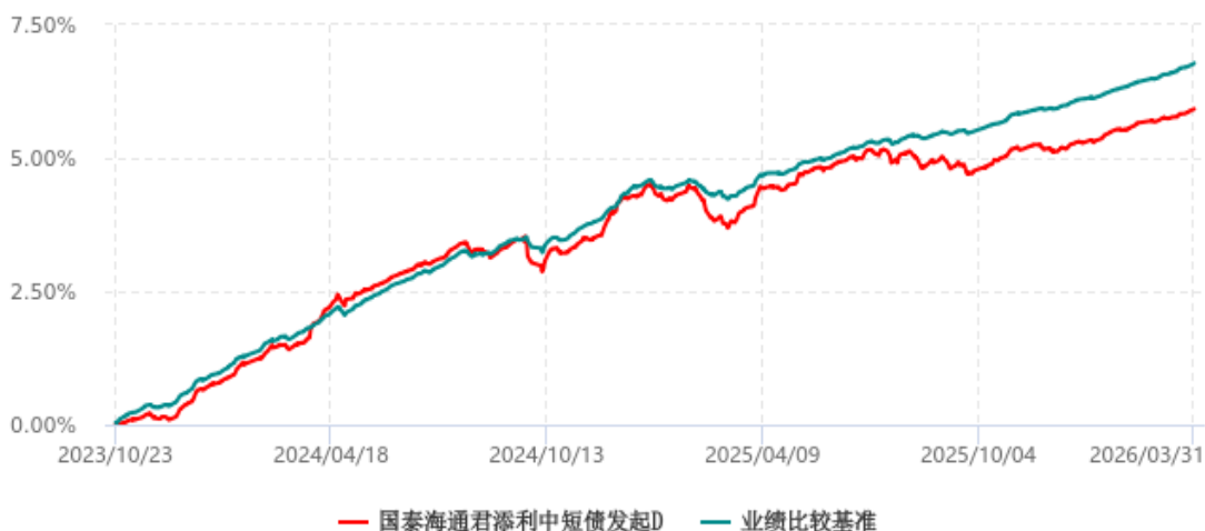
国泰海通君添利中短债发起D累计净值增长率与业绩比较基准收益率历史走势对比图 (2023年10月23日-2026年03月31日)

注：1、《国泰君安君添利中短债债券型发起式证券投资基金基金合同》生效日为 2022 年 6 月 17 日。