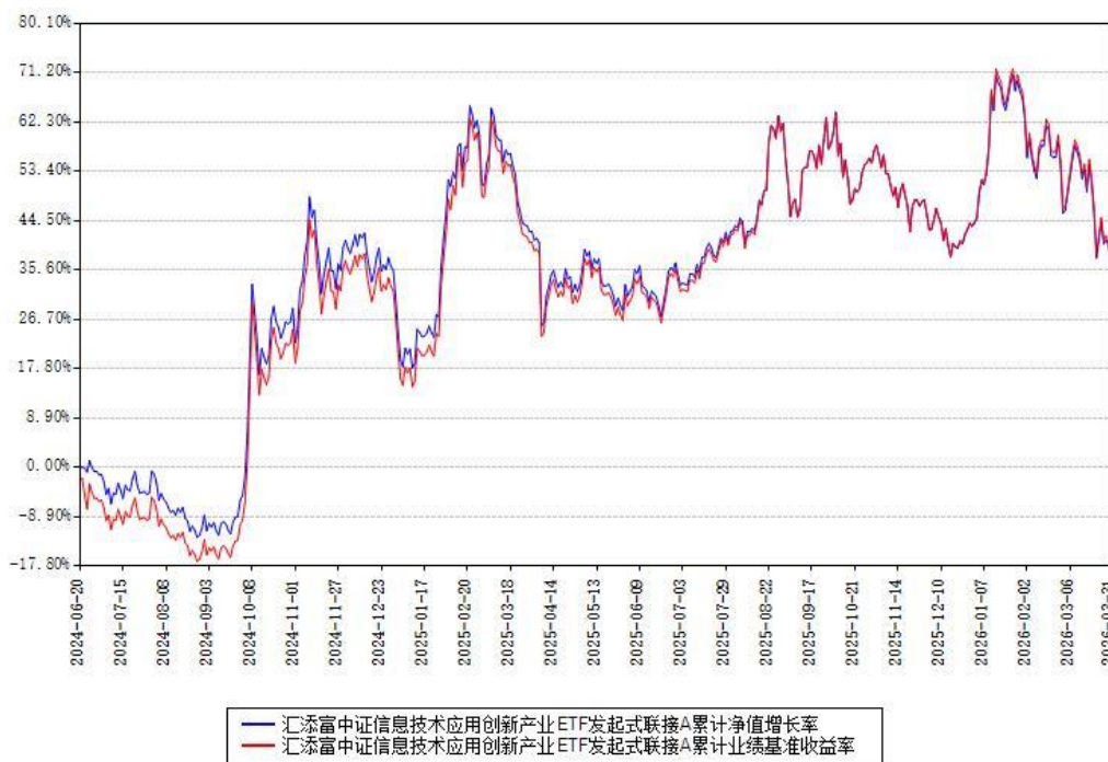
汇添富中证信息技术应用创新产业ETF发起式联接A累计净值增长率与同期业绩基准收益率对比图