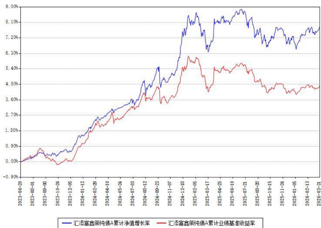
汇添富鑫荣纯债A累计净值增长率与同期业绩基准收益率对比图

（二）自基金合同生效以来基金累计净值增长率变动及其与同期业绩比较基准收益率变动的比较图