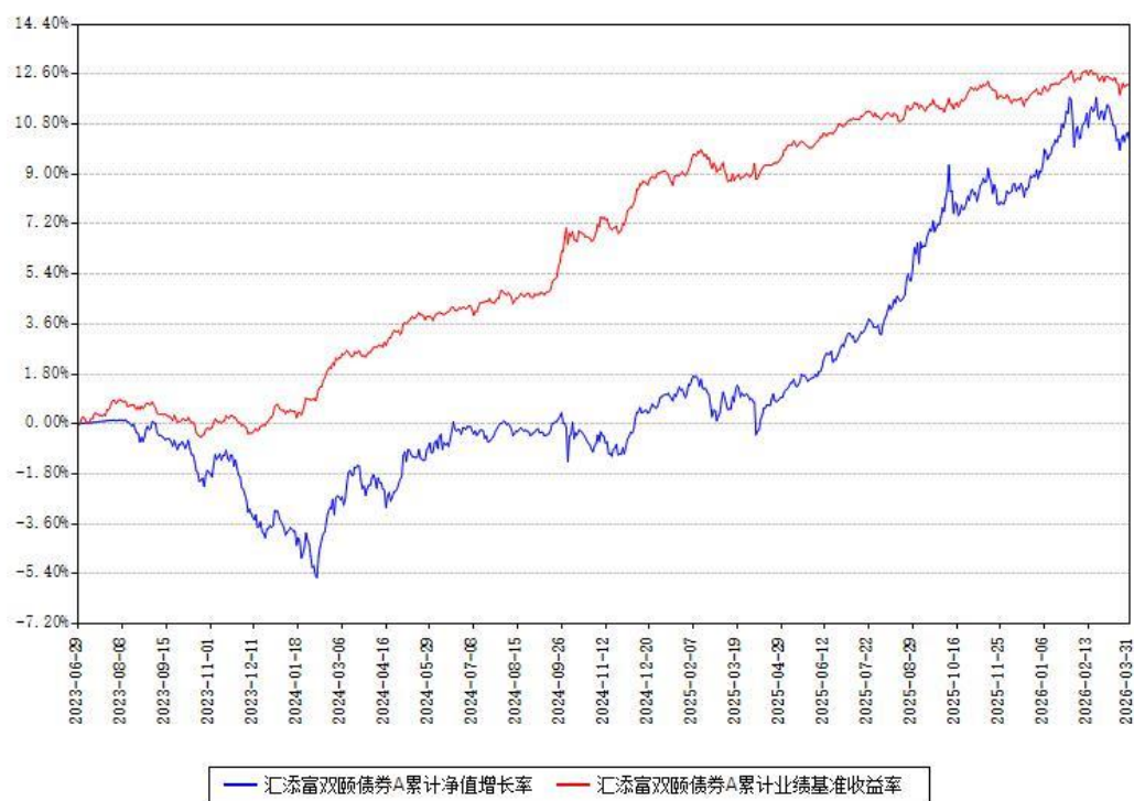
汇添富双颐债券A累计净值增长率与同期业绩基准收益率对比图

(二) 自基金合同生效以来基金累计净值增长率变动及其与同期业绩比较基准收益率变动的比较图