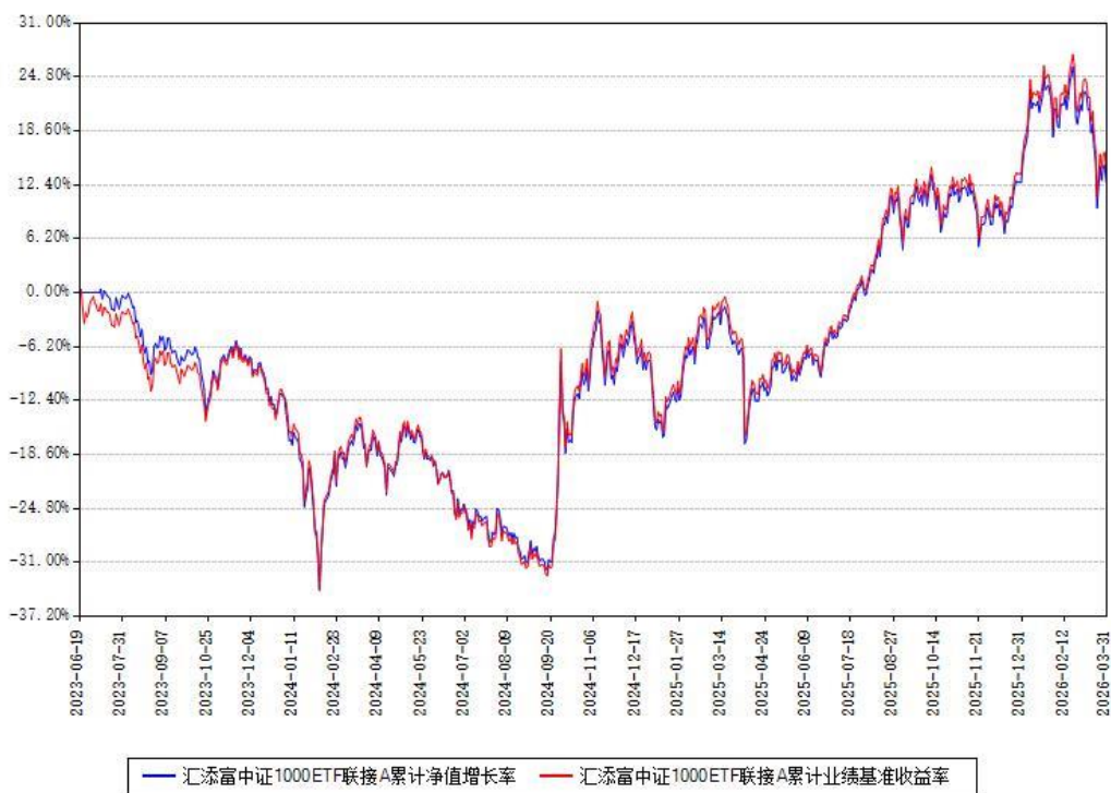
汇添富中证1000ETF联接A累计净值增长率与同期业绩基准收益率对比图

(二)自基金合同生效以来基金累计净值增长率变动及其与同期业绩比较基准收益率变动的比较图