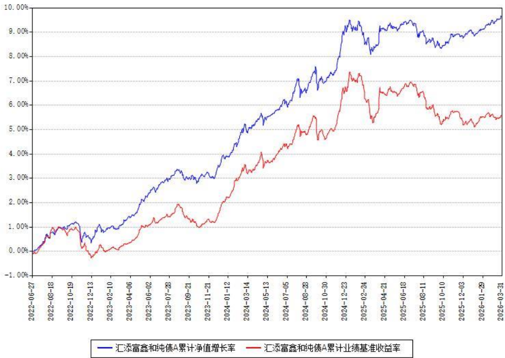
汇添富鑫和纯债A累计净值增长率与同期业绩基准收益率对比图

(二)自基金合同生效以来基金累计净值增长率变动及其与同期业绩比较基准收益率变动的比较图