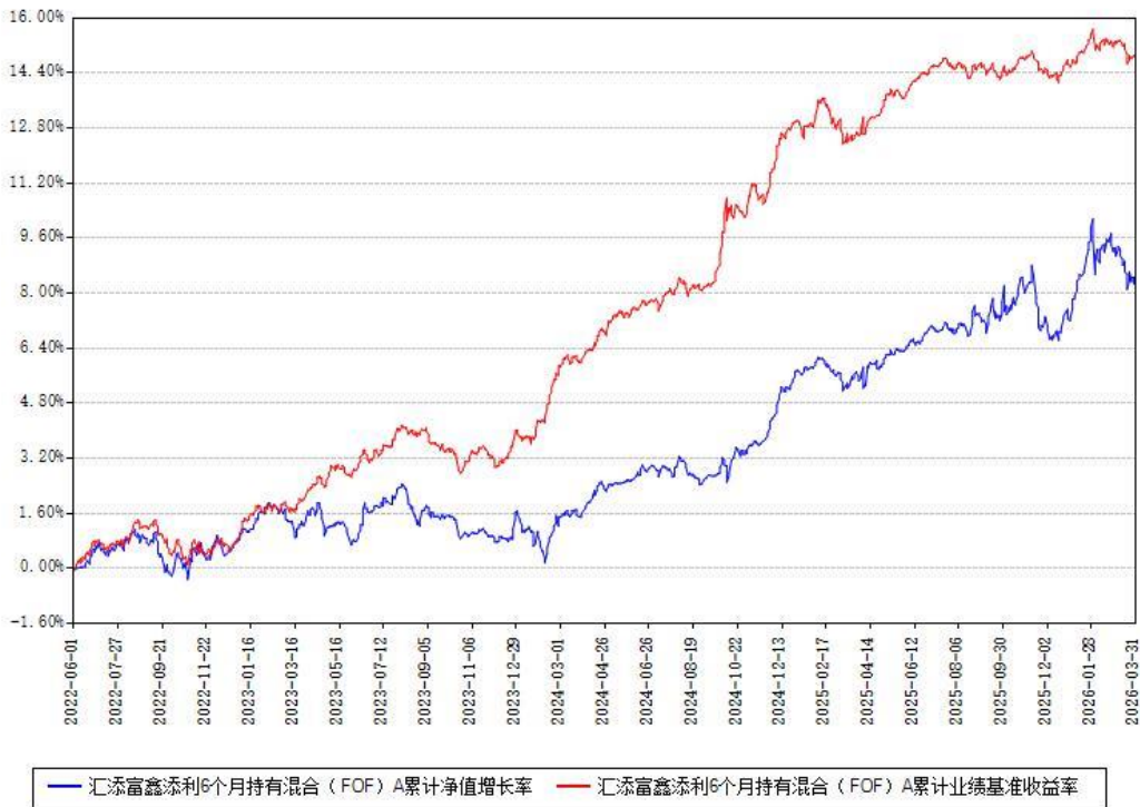
汇添富鑫添利6个月持有混合（FOF）A累计净值增长率与同期业绩基准收益率对比图