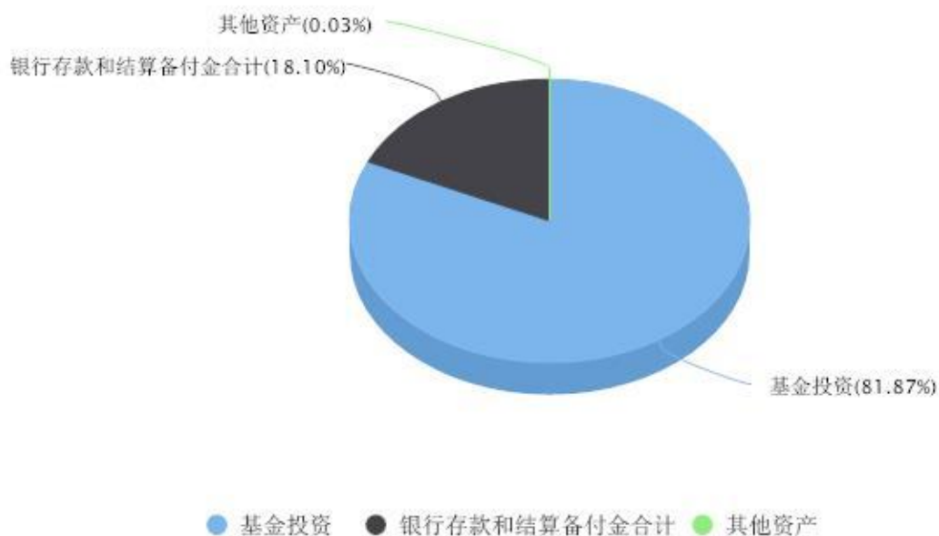
投资组合资产配置图表 数据截止日期:2026年03月31日