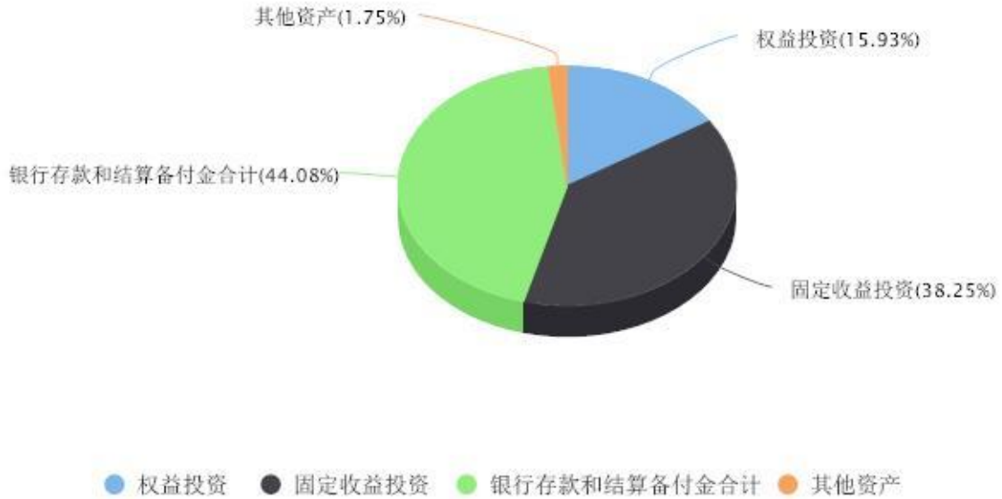
投资组合资产配置图表 数据截止日期:2026年03月31日