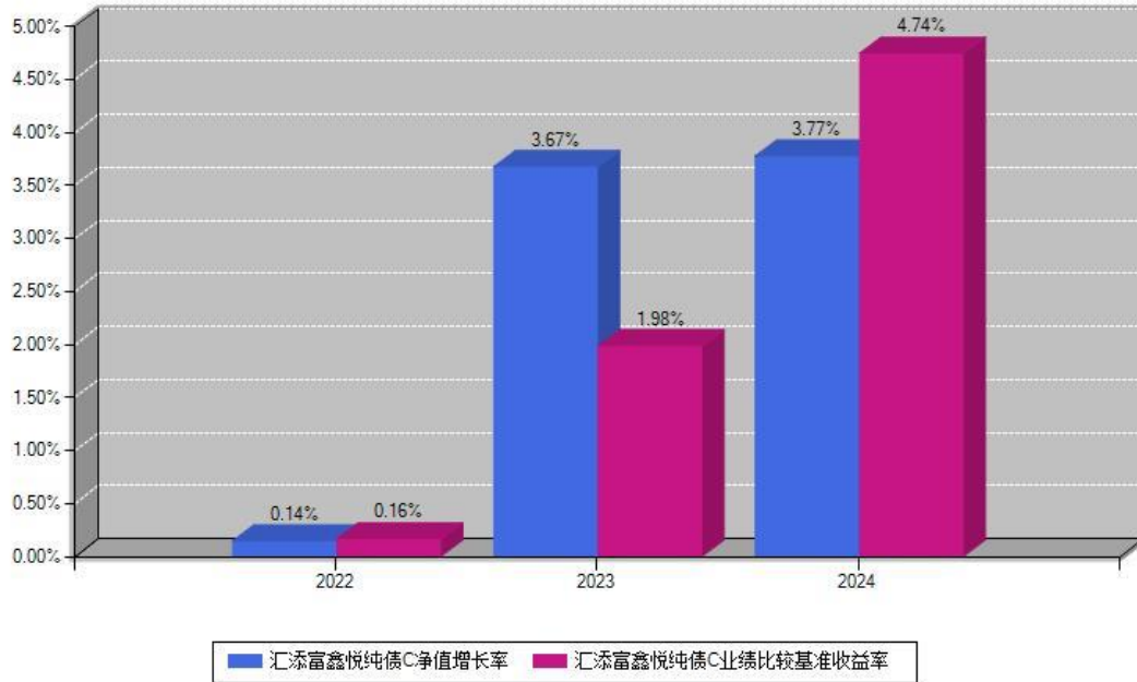
汇添富鑫悦纯债C每年净值增长率与同期业绩基准收益率对比图

注：数据截止日期为2024年12月31日，基金的过往业绩不代表未来表现。本《基金合同》生效之日为2022年12月07日，合同生效当年按实际存续期计算，不按整个自然年度进行折算。