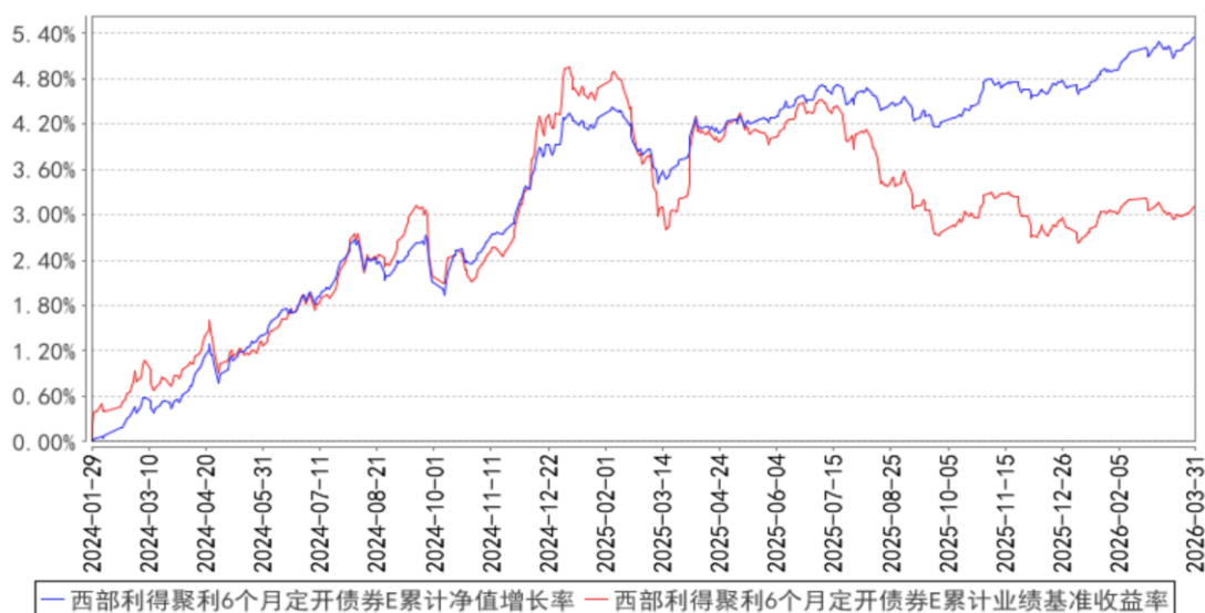
西部利得聚利6个月定开债券E累计净值增长率与同期业绩比较基准收益率的历史走势对比图

3) 西部利得聚利6个月定期开放债券型证券投资基金E(2024年01月29日至2026年03月31日)