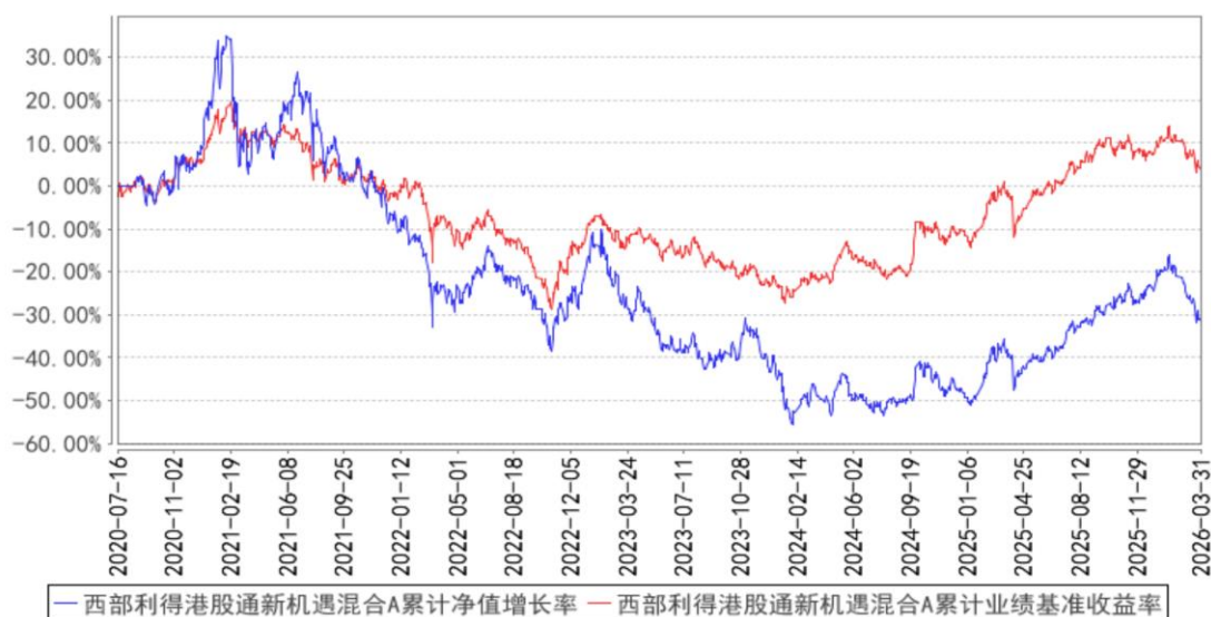
西部利得港股通新机遇混合A累计净值增长率与同期业绩比较基准收益率的历史走势对比图

2) 西部利得港股通新机遇灵活配置混合型证券投资基金 C（2020年09月02日至2026年03月31日）