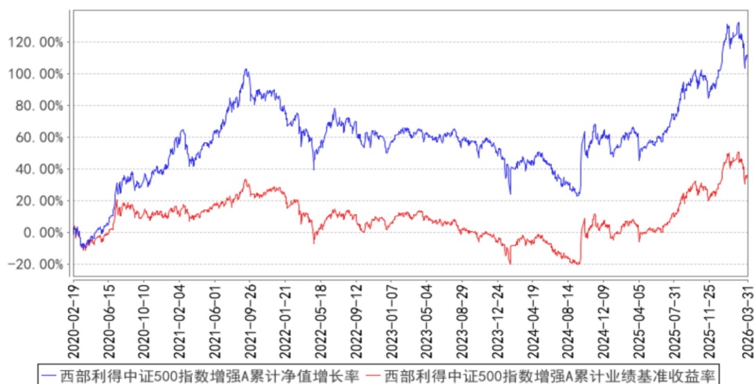
西部利得中证500指数增强A累计净值增长率与同期业绩比较基准收益率的历史走势对比图

2) 西部利得中证500指数增强型证券投资基金(LOF)C (2020年04月13日至2026年03月31日)