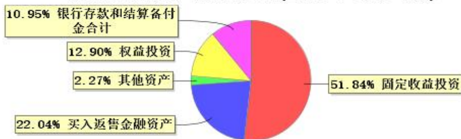
投资组合资产配置图表(2026年3月31日)

● 固定收益投资 ● 买入返售金融资产 ● 其他资产 ● 权益投资 ● 银行存款和结算备付金合计