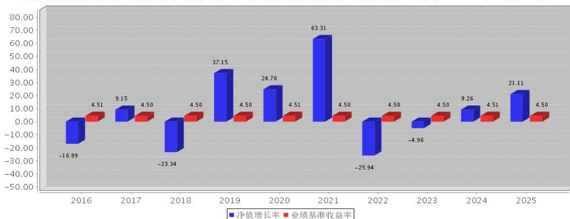
安信鑫发优选混合A基金每年净值增长率与同期业绩比较基准收益率的对比图(2025年12月31日)

注：基金合同生效当年期间的相关数据按实际存续期计算，基金的过往业绩并不代表其未来表现。